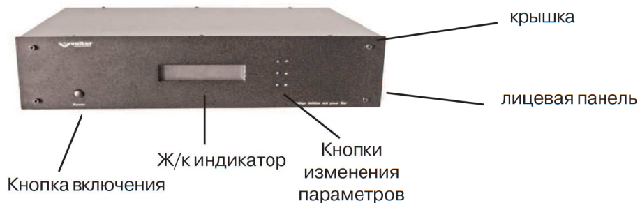
Рис. 1. Стабилизатор (вид спереди)

Стабилизатор (рис.1) выполнен в металлическом корпусе прямоугольной формы. Все функциональные узлы стабилизатора расположены на шасси, которое сверху закрыто П-образной пластиной.