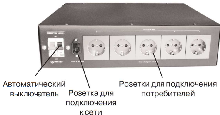
Рис.2. Задняя панель стабилизатора

На лицевой панели стабилизатора расположены кнопка включения, жидкокристаллический индикатор, показывающий уровень входного и выходного напряжения, силу потребляемого тока, а также кнопки для изменения параметров работы стабилизатора.